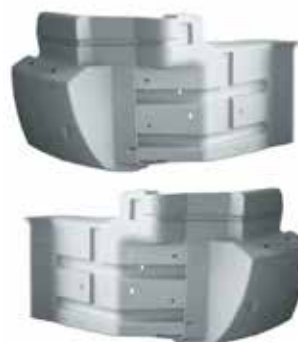
Extensión Der. . . . . FLTVH482 Extensión Izq . . . . . FLTVH483