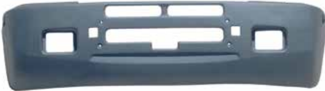
Def ensa T-600 . . . . . FLT VH128