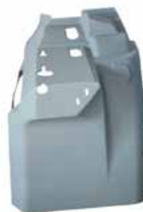
Extensión Der..... FLTVH100 Extensión Izq .....FLTVH101