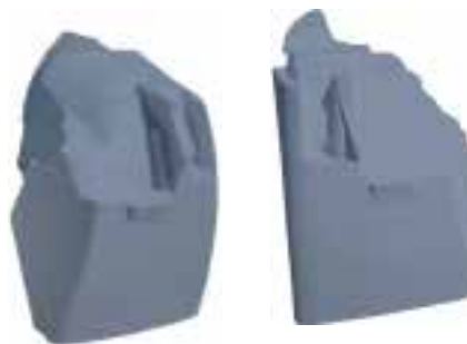
Extensión Der.....FLTVH213 Extensión Izq .....FLTVH214