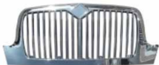
Parrilla 4300, 4400. . . .FLTVH215