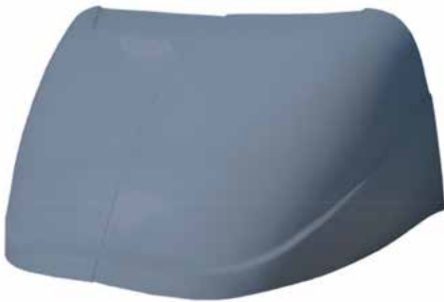
Rompevientos T-600/ T-800. . . . . FLTVH146