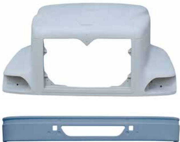
Cofre 9200 .....FLTVH099 Cofre 9400 .....FLTVH284 Defensa 9200/9400...FLTVH129