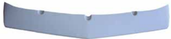
Visera para cabina T-800. . . . . FLTVH209