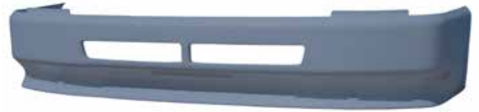
Defensa VNL 2a. Gen . FLTVH277