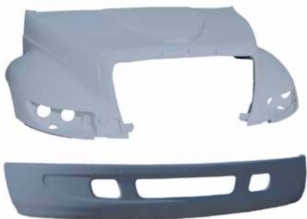
Cofre .....FLTVH212 Defensa .....FLTVH095