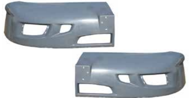
Lateral Defensa Der . . FLTVH374