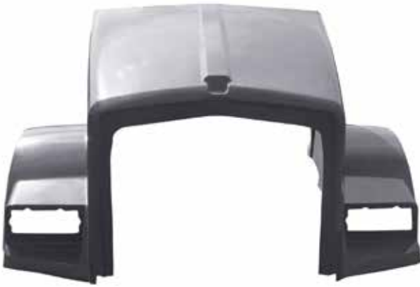
Cofre T-800 . . . . . FLTV H498