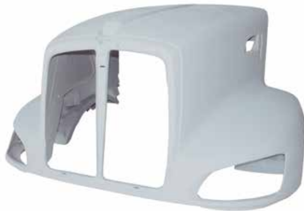
Cofre T-660 . . . . . FLTVH395