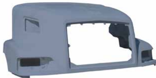
Cofre VNL 2a. Gen. . . . FLTVH236