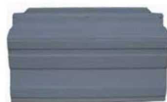
Estribos 9200,9400 Der. . . . . FLTVH273 Izq. . . . . FLTVH274