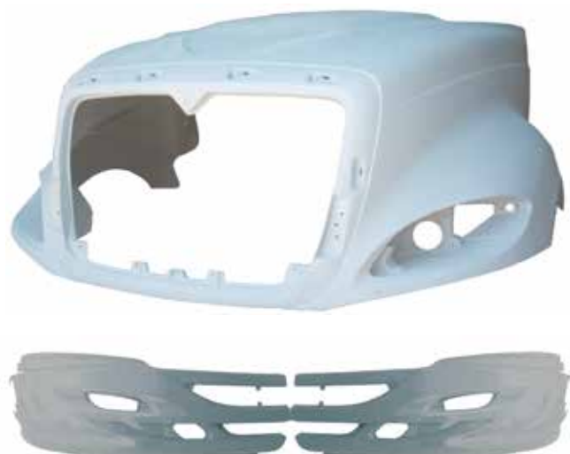
Cofre . . . . . FLTVH481 Lateral Defensa Der . . FLTVH486 Lateral Defensa Izq . . . FLTVH487