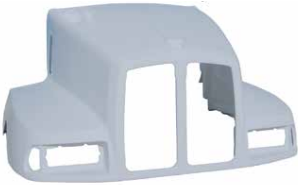
Cofre T-600 . . .AERO FLTVH044