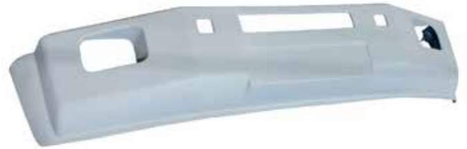
Defensa T-800 . . . . . FLTVH121