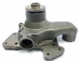
NO. DE PARTE FLEETRITE MM900063F