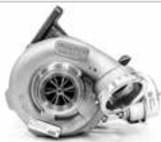
NO. DE PARTE FLEETRITE MM100287F