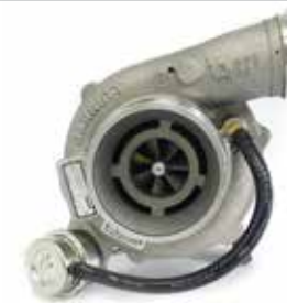
NO. DE PARTE FLEETRITE MM100141F