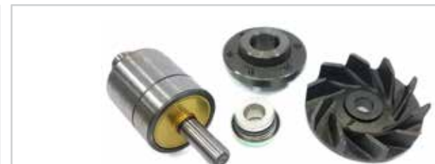
NO. DE PARTE FLEETRITE MM100382F