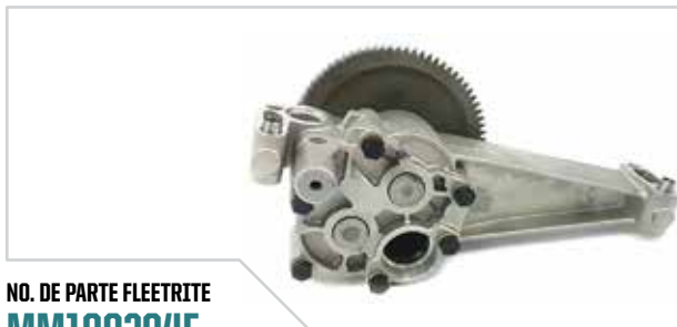
NO. DE PARTE FLEETRITE MM100294F