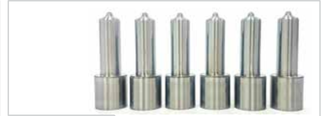
NO. DE PARTE FLEETRITE MM100312F