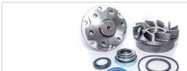
NO. DE PARTE FLEETRITE MM100381F