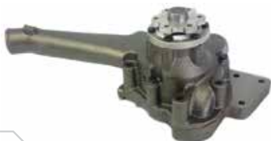
NO. DE PARTE FLEETRITE MM900061F