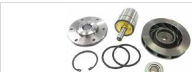
NO. DE PARTE FLEETRITE MM100380F