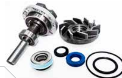
NO. DE PARTE FLEETRITE MM100363F