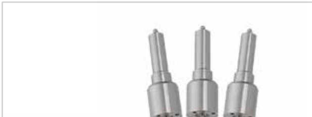
NO. DE PARTE FLEETRITE MM100314F