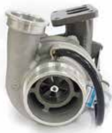
NO. DE PARTE FLEETRITE MM100140F