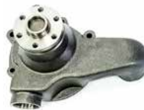
NO. DE PARTE FLEETRITE MM900064F