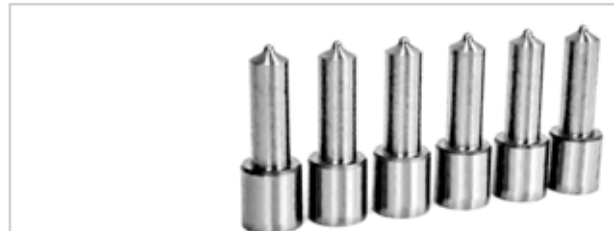
NO. DE PARTE FLEETRITE MM100315F