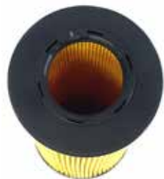
NO. DE PARTE FLEETRITE MM100358F