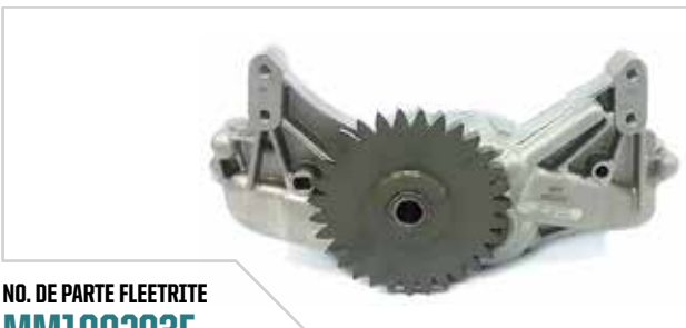
NO. DE PARTE FLEETRITE MM100293F