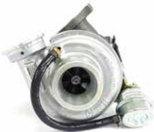
NO. DE PARTE FLEETRITE MM100134F