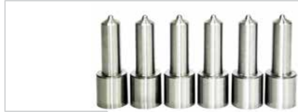
NO. DE PARTE FLEETRITE MM100307F