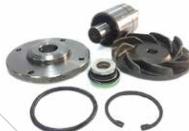
NO. DE PARTE FLEETRITE MM100361F