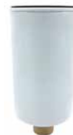
NO. DE PARTE FLEETRITE MM100359F