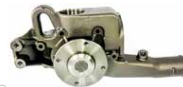
NO. DE PARTE FLEETRITE MM900067