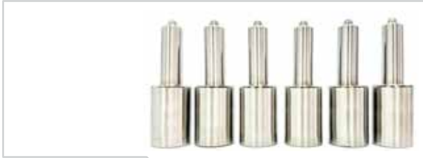
NO. DE PARTE FLEETRITE MM100301F