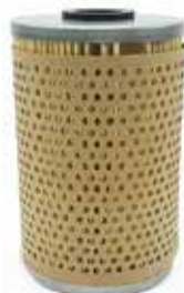
NO. DE PARTE FLEETRITE MM100347F